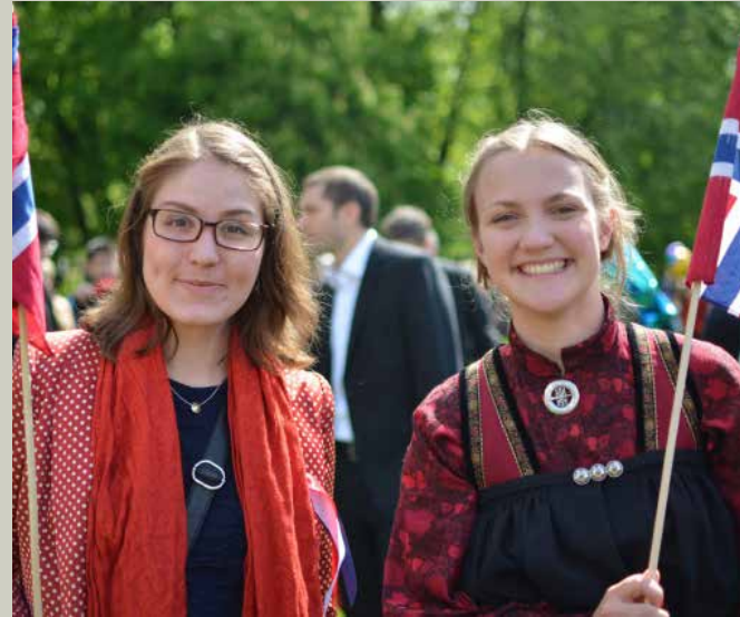
Noruega cuenta con un Ministerio de Infancia e Igualdad instituido hace 12 años.

A la fecha bancos como Banamex, Banorte y HSBC ya tienen filtros ambientales, sociales y de gobierno corporativo (ESG) al analizar ciertos financiamientos, pero sus resultados no son publicados, es decir, no podemos saber si estos bancos rechazaron proyectos, cuántos, cuáles, ni las razones para ello o las condicionantes que se les agregaron a los proyectos. De esta forma quién sabe qué banco estaba financiando el proyecto de Tajamar. Si algún banco con filtros ESG lo hubiera tenido probablemente se hubiera detectado el riesgo que la empresa no había previsto, de ahí que contar con bancos éticos es bueno para todos por muchas razones.