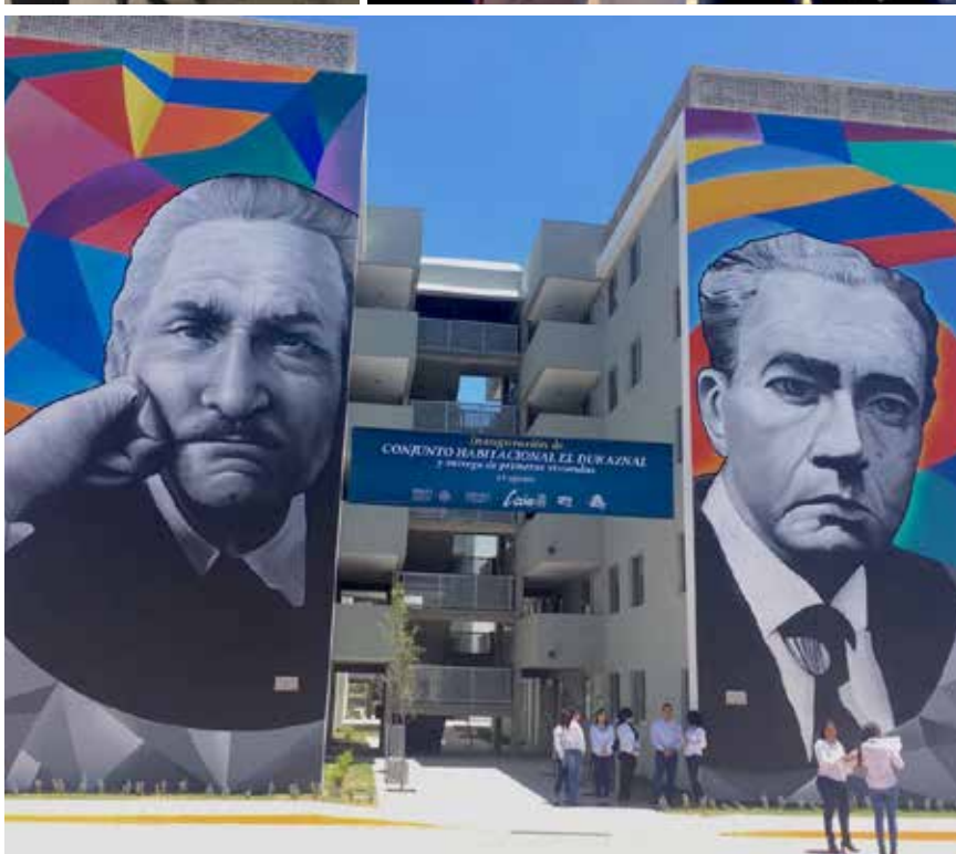
Los grandes mitos de las literatura mexicana, Carlos Fuentes y Juan Rulfo, 'decoran' El Duraznal