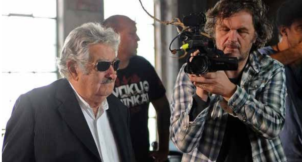
Además de esta producción, está próximo el estreno de otro documental dedicado a José Mujica que tendrá como título el 'El último héroe' realizado por el legendario cineasta Emir Kusturica.