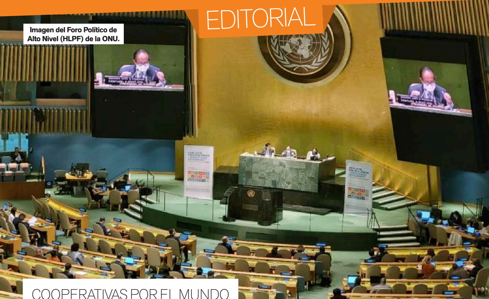
Imagen del Foro Político de Alto Nivel (HLPF) de la ONU.