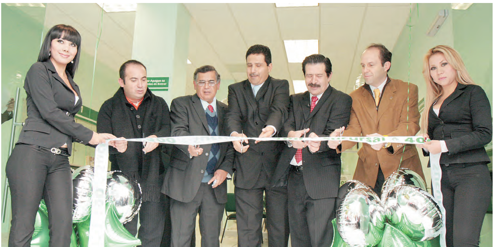
Dirigentes y funcionarios de Caja Popular Mexicana acompañados de funcionarios estatales y municipales, cortaron el listón inaugural de la sucursal 400.

Para conocer la ubicación y horario de servicio de su sucursal más cercana, visite www.cpm.org.mx o llame al 01 800 71 00 800 (lada sin costo).