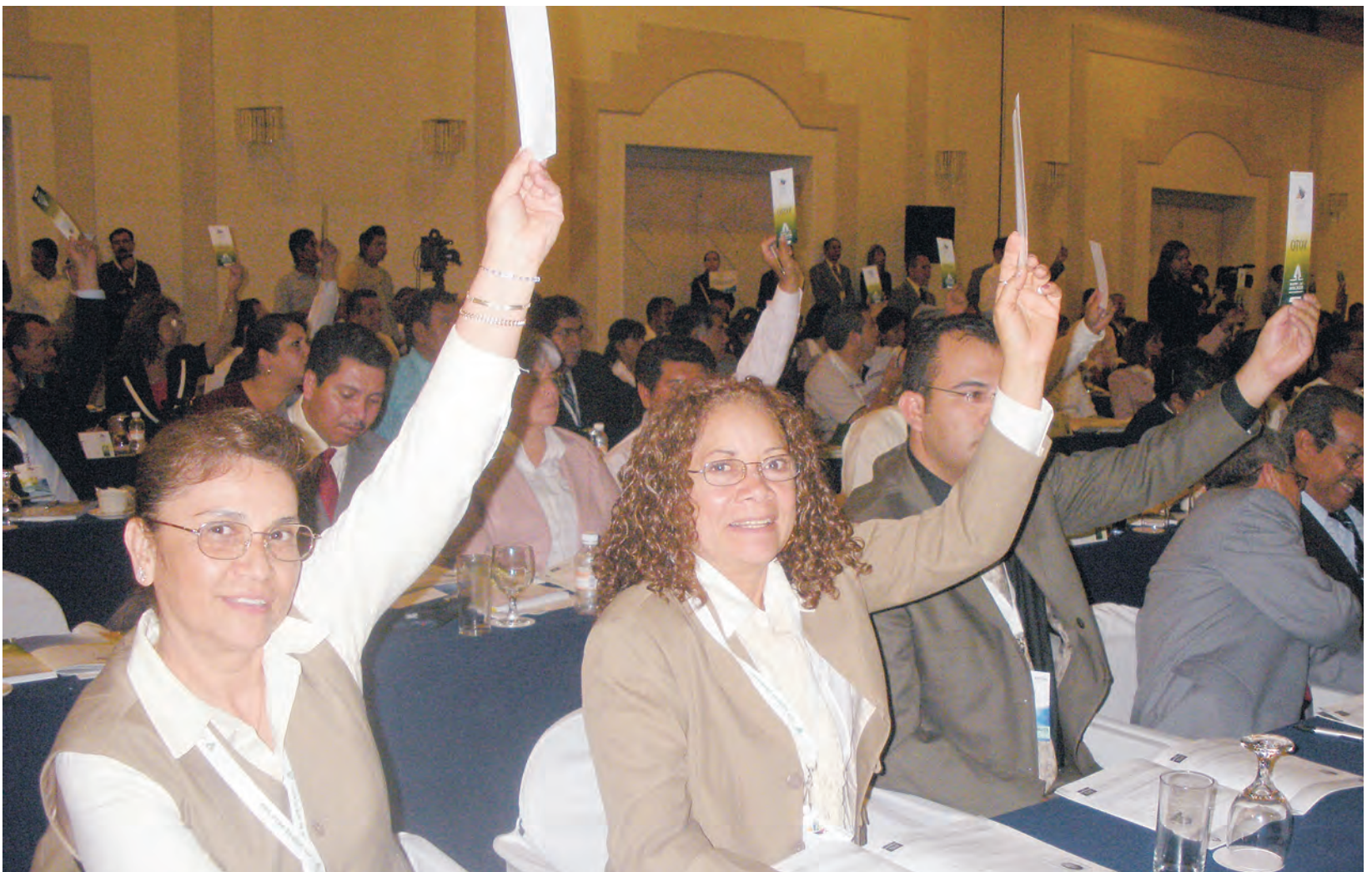
Porque a Caja la enriquecen sus socios, ejerza su derecho y compromiso al participar en su asamblea, es su oportunidad.