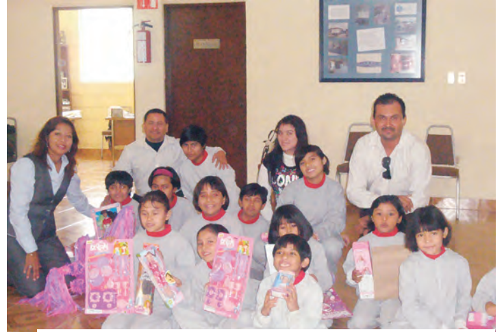
Niñas y niños de la casa hogar Leche y miel recibieron juguetes de manos de colaboradores de CPM.

Además de esta actividad, alrededor de 50 personas recibieron los servicios de CPM en su comunidad con información general de la cooperativa sumándose a los más de 1 millón 570 mil asociados que ya forman parte de Caja Popular Mexicana.