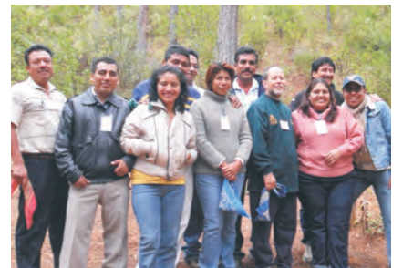
Integrantes del Comité Promotor de diversas sucursales participaron en el taller de liderazgo de CPM.

A la par, socios-dirigentes de Caja Popular Mexicana se reunieron en San José del Pacífico, para, con dinámicas de integración, lograr el liderazgo asertivo puesto al servicio de los propios socios de la cooperativa.