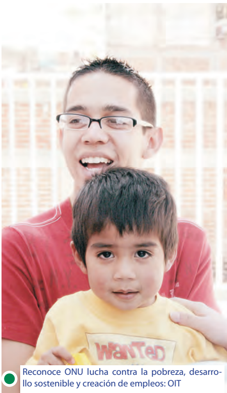
Reconoce ONU lucha contra la pobreza, desarrollo sostenible y creación de empleos: OIT

La Asamblea General de la Organización de las Naciones Unidas, ONU, apoyada por 55 países (entre ellos varios latinoamericanos) proclamó el 2012 como el "Año Internacional de las Cooperativas".