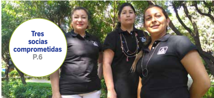
Tres socias comprometidas P.6