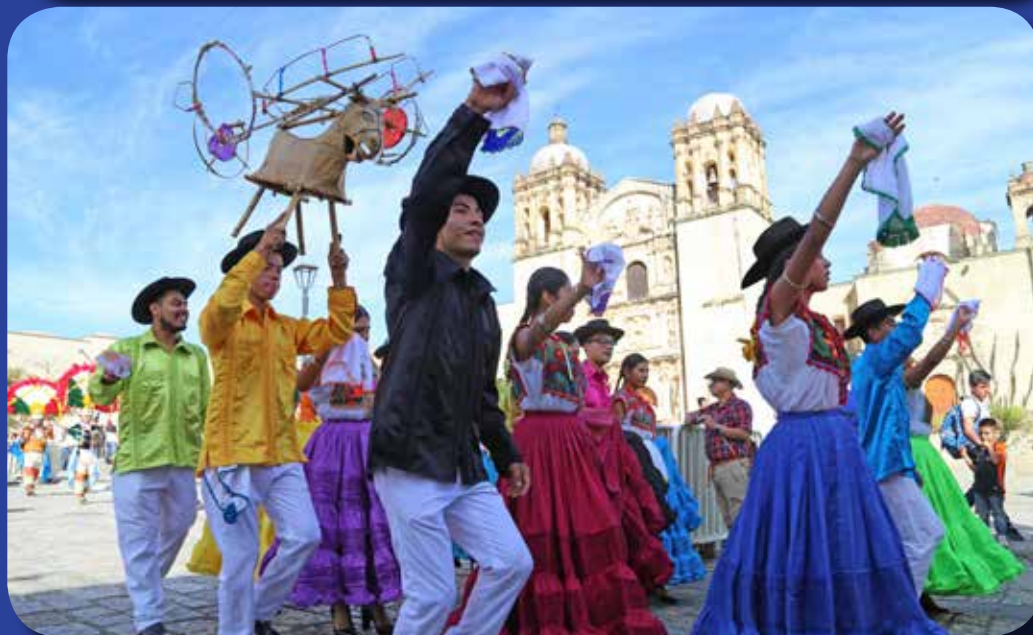
1. Torre de Iglesia; 2. Ventanas de Torre; 3. Sombrero en mujer de la derecha; 4. Color de pañuelo centro; 5. Rueda de piroletta.

Diviértete encontrando las diferencias que existen en esta imagen en la que jóvenes de Oaxaca realizan uno de sus bailes tradicionales.