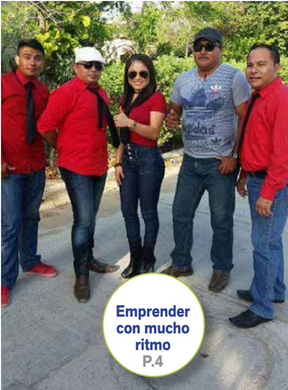
Emprender con mucho ritmo P.4

Todo comienza con la imaginación. Y hoy más que nunca debemos echar a andar nuestros más valiosos sueños y comenzar a imaginar cómo podemos alcanzarlos. Nunca es tarde para imaginar una meta y alcanzarla. Tenemos aún mucho por imaginar.