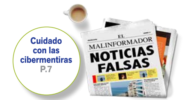
Cuidado con las cibermentiras P.7