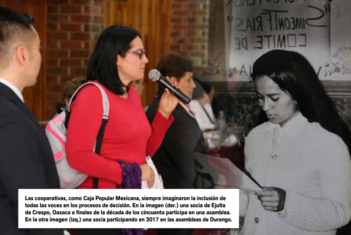
Las cooperativas, como Caja Popular Mexicana, siempre imaginaron la inclusión de todas las voces en los procesos de decisión. En la imagen (der.) una socia de Ejutla de Crespo, Oaxaca a finales de la década de los cincuenta participa en una asamblea. En la otra imagen (izq.) una socia participando en 2017 en las asambleas de Durango.

www.cnbv.gob.mx Sección: Ahorro y Crédito Popular Sociedades Cooperativas de Ahorro y Préstamo. Comisión Nacional para la Protección y Defensa de los Usuarios de Servicios Financieros (CONDUSEF) www.condusef.gob.mx Sección: Entidades de Ahorro y Crédito Popular 01 800 999 80 80