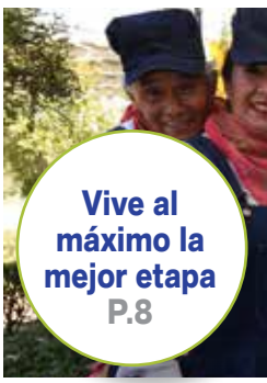
Vive al máximo la mejor etapa P.8