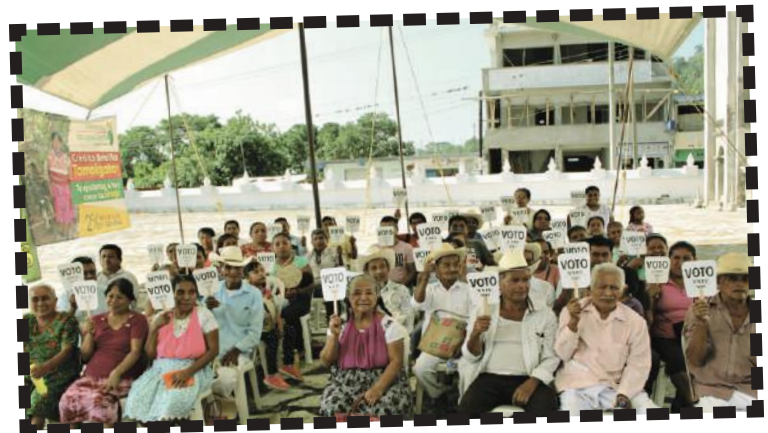
Participación activa de los socios.

E n Patrimonio te presentamos a los ganadores de cada una de las categorías de este concurso, sus imágenes plasmaron los ideales del cooperativismo y como impacta para bien en la sociedad.