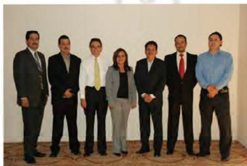
Miembros del Consejo Directivo y Consejo de Vigilancia de la nueva Federación.