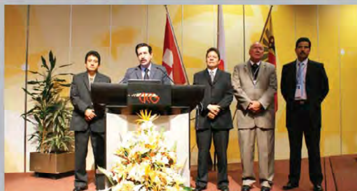
Presidente y delegados de ACI-Américas en la asamblea de ACI mundial celebrada en Ginebra, Suiza.

Ginebra, Suiza (20 nov 2009). En el marco de la asamblea mundial de la Alianza Cooperativa Internacional (ACI) celebrada en esta ciudad, representantes de las organizaciones cooperativas mexicanas afiliadas a este organismo anunciaron la celebración de este magno evento a celebrarse en México en el año 2011.