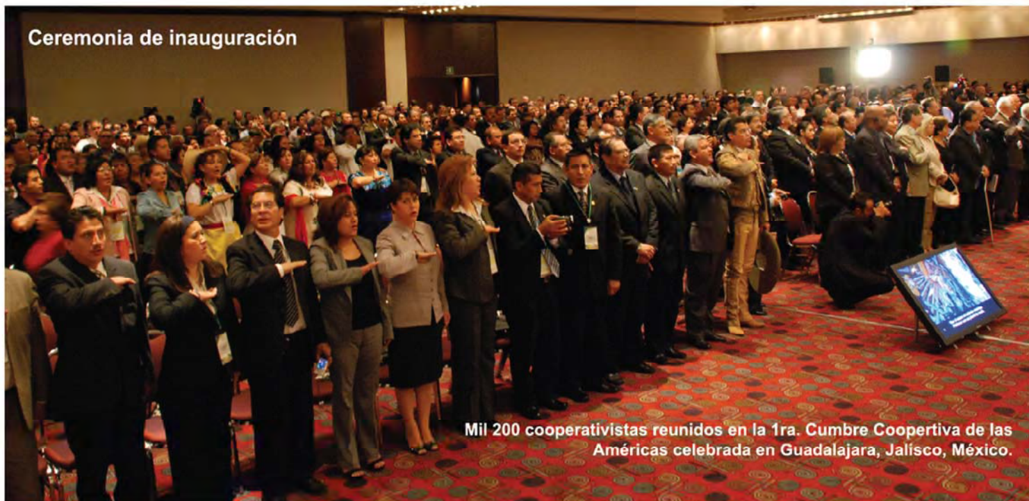
Ceremonia de inauguración

Mil 200 cooperativistas reunidos en la 1ra. Cumbre Cooperativa de las Américas celebrada en Guadalajara, Jalisco, México.