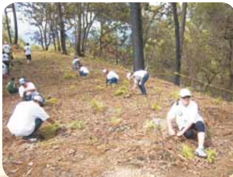
Jugaremos en el bosque, Plaza Tepic

Es por ello que Caja Popular Mexicana a través de sus programas de educación cooperativa busca crear mayor conciencia en los participantes sobre el cuidado de nuestro ambiente a través de conferencias y talleres explicando los diferentes tipos de contaminantes y el grado con que afectan a nuestro ecosistema y por ende a las comunidades donde se desenvuelven los socios.