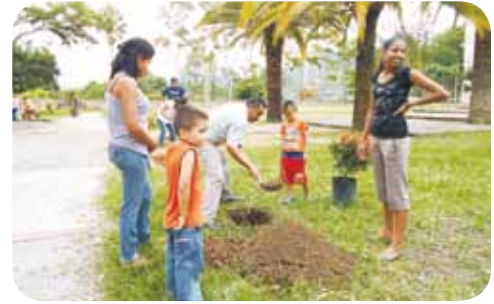
Más vida, Plaza Oaxaca

"Gracias a Caja Popular Mexicana por apoyarnos con este tipo de programas que nos ayudan a crecer en todos los aspectos".