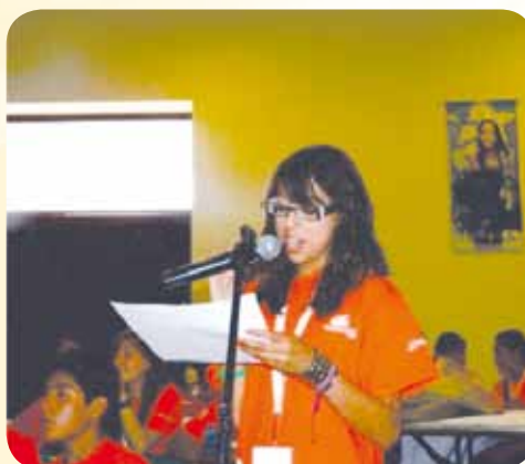
Conclusiones del encuentro.