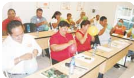
Socios de Plaza Coatzacoalcos, participando activamente.

así como un sincero agradecimiento a la cooperativa, por brindarles un espacio para desarrollarse de manera personal y profesional.