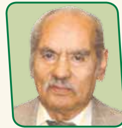
Prof. Florencio Eguía Villaseñor Filósofo y asesor moral de CPM

La Organización de las Naciones Unidas, ONU, ha declarado el año 2012 como el año de las cooperativas. Y lo ha hecho para homenajearlas, para apoyarlas en sus objetivos, para que en todo el mundo se conozca la cooperación y el cooperativismo.