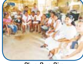
Plaza Poza Rica