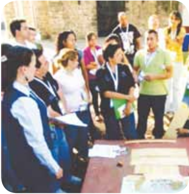
Encuentro regional Querétaro