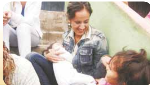
Visita a casa-hogar, Plaza Coecillo