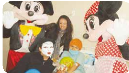
Una sana sonrisa, Plaza Orizaba

En Caja Popular Mexicana en 2011 a través de los programas de educación cooperativa se llevó a la práctica este valor mediante la realización de 494 actividades comunitarias en las que participaron 29,084 empleados, dirigentes y socios, y se benefició aproximadamente a 71,113 personas.