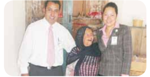
Alimento para todos, Plaza Guanajuato Norte