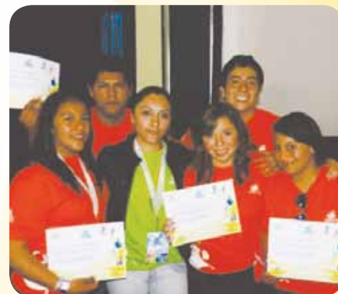
Ganadores de Plaza Orizaba.