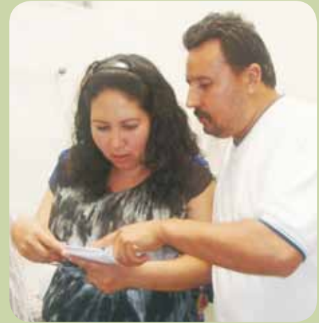
Finanzas en el matrimonio Plaza Aguascalientes

"Es fácil formar cooperativas, pero es difícil hacer cooperativistas".