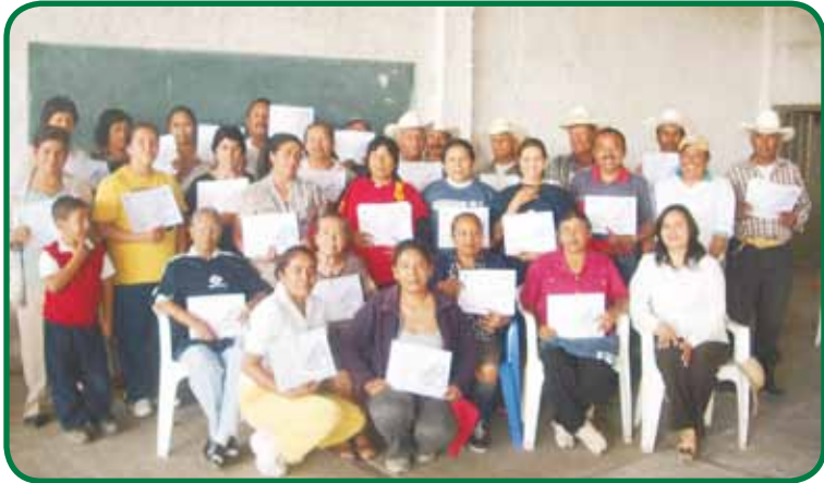
Plaza Bajío Centro