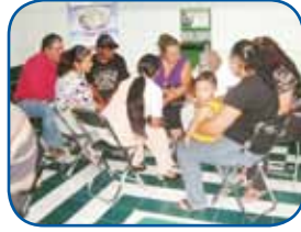
Plaza San Francisco