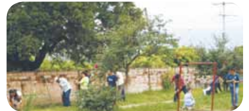
Sembrando vida, Plaza Oaxaca