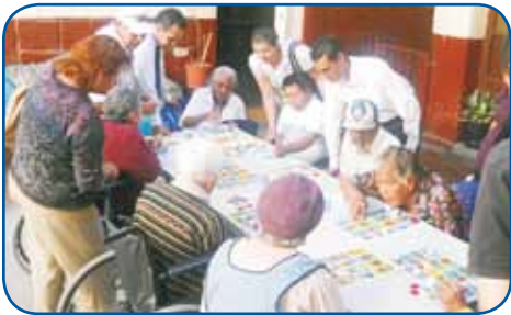
Plaza San Luis