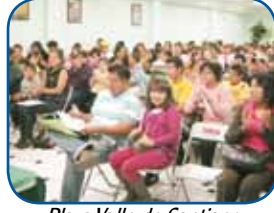
Plaza Valle de Santiago