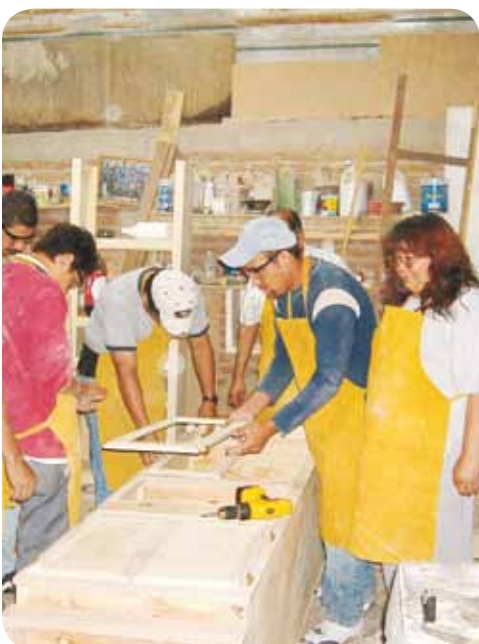
Talleres productivos en Plaza Delicias