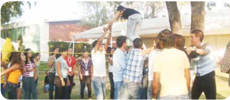
Encuentro regional San Luis Potosí

Caja Popular Mexicana comprometida en dar continuidad al proceso formativo de sus jóvenes cooperativistas, ha desarrollado el programa de formación cooperativa: Juventud Cooperadora para socios de 18 a 30 años, en el que participaron 565 socios a nivel nacional.