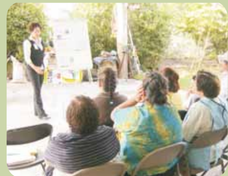
Nivel Básico con socios en Plaza Valle de Santiago