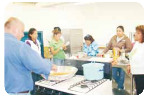
Plaza Guanajuato Norte