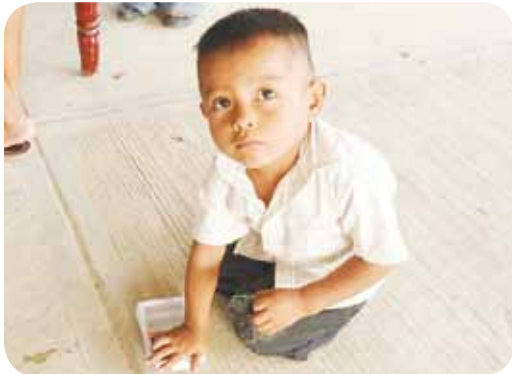
Cooperamos por tí, Plaza Poza Rica

"El compromiso social en las cooperativas es la respuesta valiente de quienes no quieren malgastar su vida sino que desean ser protagonistas de la historia personal y social".