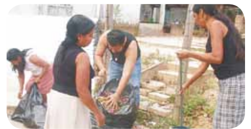
Limpiando la ciudad, Plaza Miahuatlán