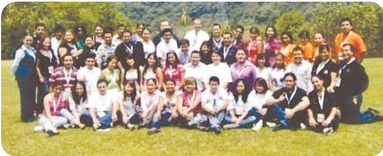
Encuentro regional Orizaba