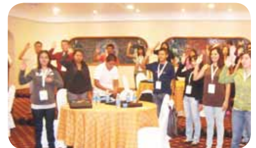
Encuentro juventud cooperadora

En nuestra cooperativa lo más valioso es nuestro capital humano, nuestra gente.