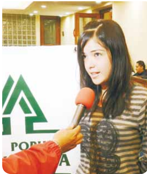
TV entrevista en GENERACIÓN 2011

En las cooperativas, la educación es fundamental para sus socios, pues la educación puede crear una empresa verdaderamente autogobernada y hacer de sus dueños empresarios auténticos; y sólo con educación, si es constante y sistemática, puede hacerse de las personas verdaderos SOCIOS—dueños y clientes—y no sólo usuarios indiferentes a los que no les interesa, ni el presente ni el futuro de la cooperativa y mucho menos el de los demás. La cooperativa debe realizar una constante y eficiente labor educativa, si no la hace,