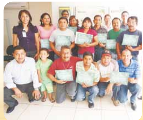
Socios de Plaza Poza Rica.

* Inscríbete en: www.cpm.org.mx sección "Educación cooperativa y financiera".