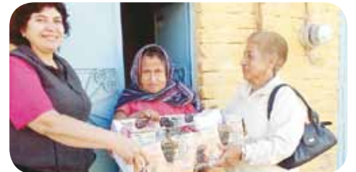
DA LATA, Plaza Celaya