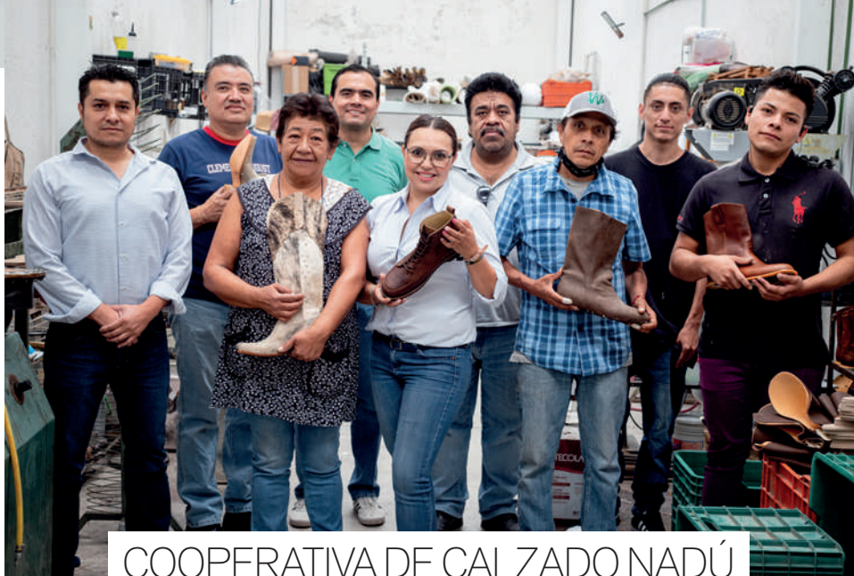
COOPERATIVA DE CALZADO NADÚ