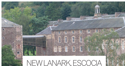
NEW LANARK, ESCOCIA