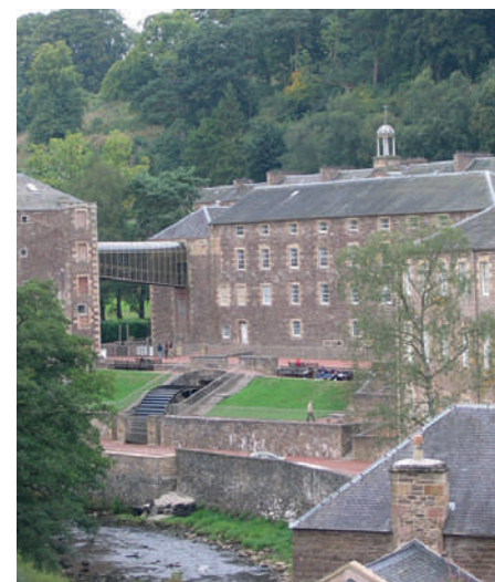
Imagen antigua de New Lanark.

nes, luego de que la industria textil decaería, lo que resultó en la migración de sus habitantes.