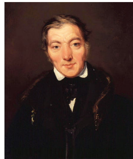
Imagen de Robert Owen, empresario, filántropo y teórico socialista.

La tierra prometida trajo bienestar a sus habitantes durante un par de generacio-