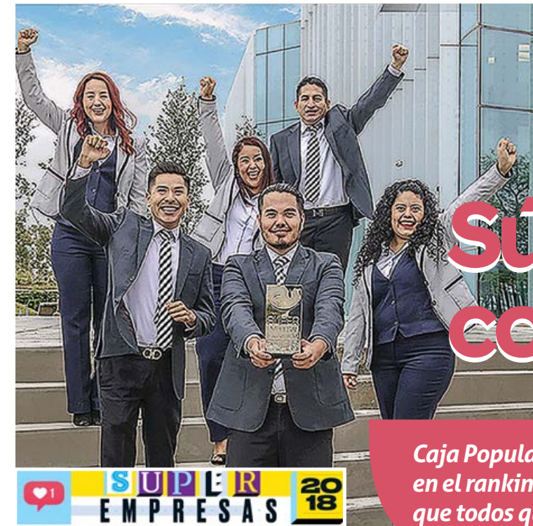
Desde 2012 Caja Popular Mexicana participa en el ranking Súper Empresas