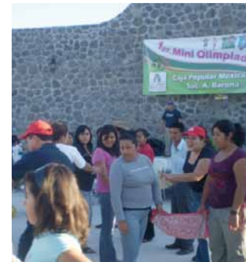
● Caja Popular Mexicana promueve la salud, el deporte y la unidad familiar.