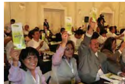
● Delegados presentes en la asamblea nacional