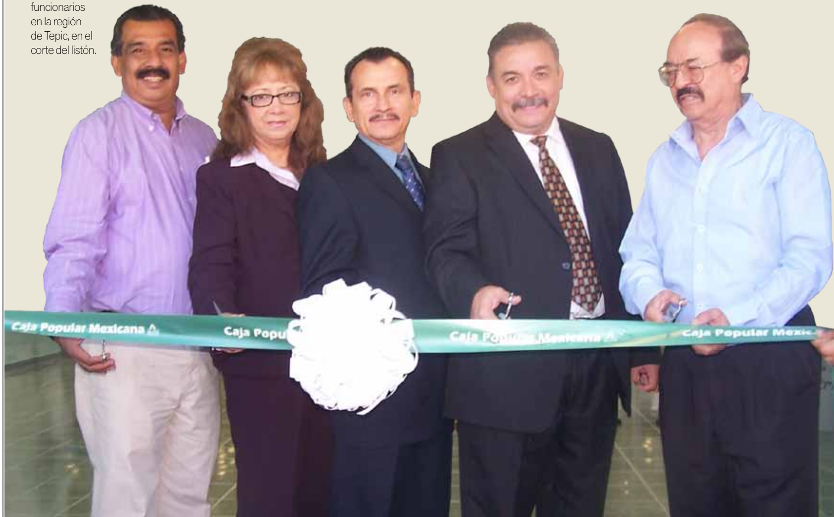
● Directivos y funcionarios en la región de Tepic, en el corte del listón.

VÍCTOR MANUEL GUZMÁN MENCHACA / GÓMEZ PALACIO, DURANGO.