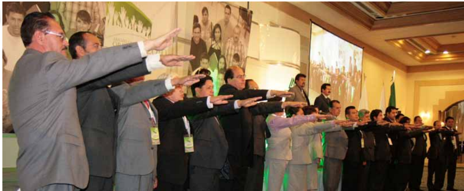
● Toma de protesta de dirigentes