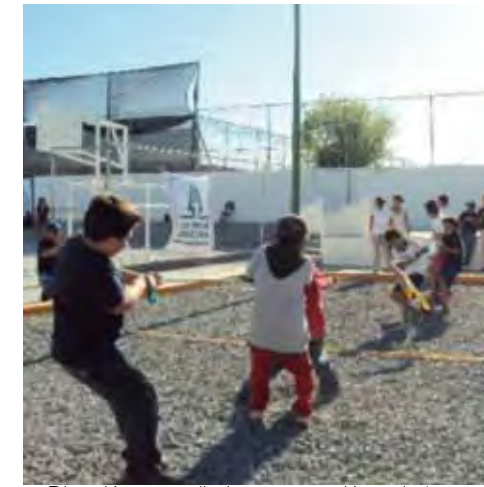
● Diversión, aprendizaje y cooperación en la 1er. miniolimpiada infantil cooperativa.