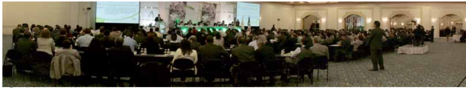
● Panorámica de la asamblea general de socios