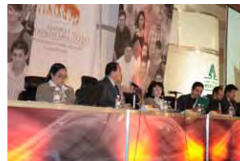
● Presidium de la asamblea general extraordinaria de socios

Caja Popular Mexicana mantiene un ritmo de crecimiento importante; de acuerdo a sus estadísticas, a diciembre del 2009, contaba con más de 1 millón 589 mil socios, la captación de sus socios (ahorro e inversión) era de más de 18 mil millones de pesos y la cartera de préstamos ascendía a más de 17 mil 700 millones de pesos. Tiene presencia en 22 estados del país y actualmente ha integrado ya sus propios cajeros automáticos y tarjetas de débito.