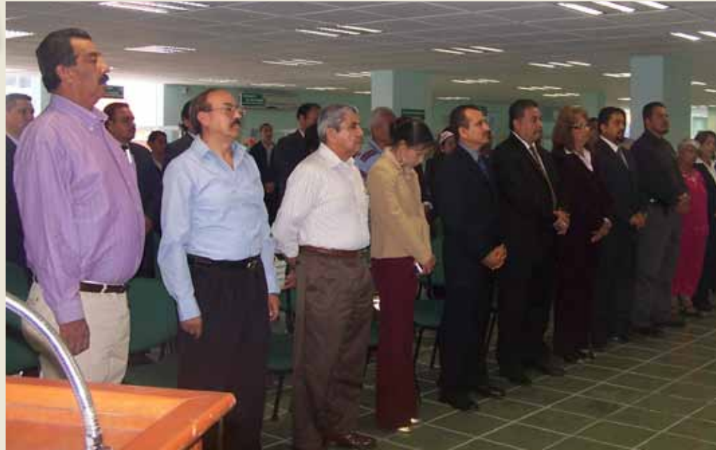
● Sucursal La Loma para el servicio de los socios de la región.

ERIC ALBERTO GÓMEZ SILVA / TEPIC, NAYARIT