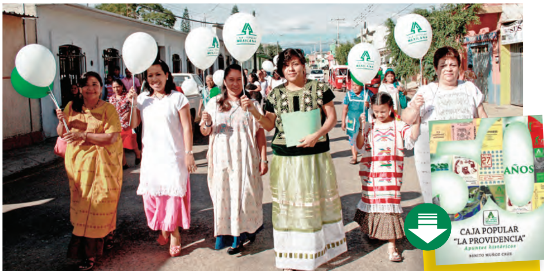
La Calenda, que es un tradicional recorrido a pie por todo el poblado, marcó el inicio de la celebración.