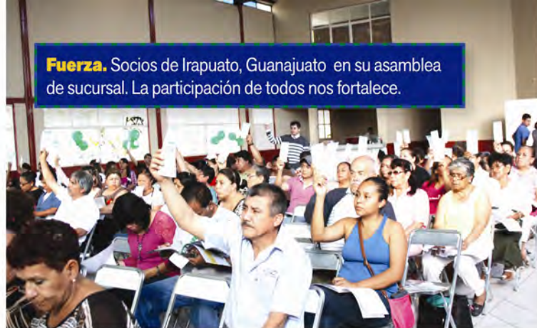
Fuerza. Socios de Irapuato, Guanajuato en su asamblea de sucursal. La participación de todos nos fortalece.